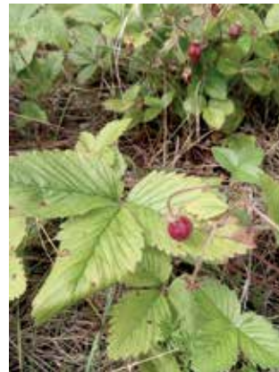
Ukkomansikka on ajalta ennen puutarhamansikoita. Ne tarvitsevat sekä hede- että emikasin tuottaakseen mansikoita.