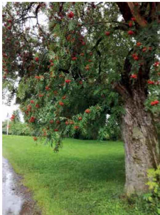
Kotipihlaja Putkisaloon kartanossa.