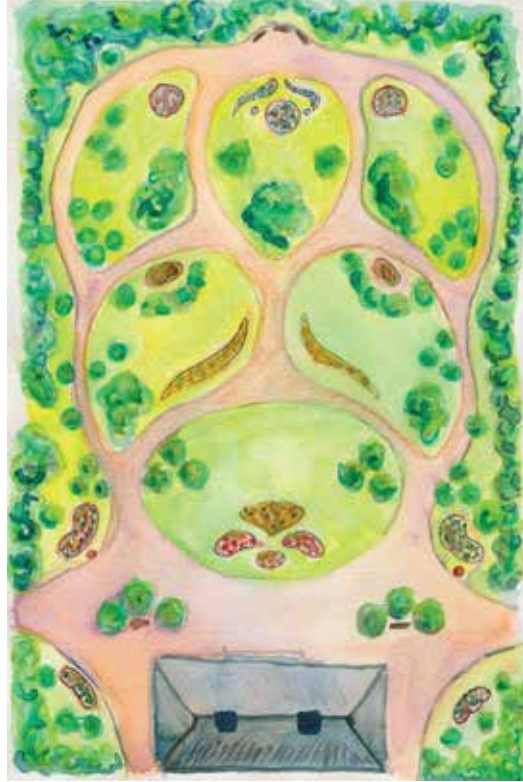
Vuosisadan loppupuolella kahden edellisen vuosisadan tyylipiirteistä syntyi uusi sovellus, jota kutsuttiin myös ”saksalaiseksi” tyyliksi, joka sopi myös kooltaan pienempiin puutarhoihin. Kuvälähteen pohjana Daniel Müllerin piirustus, 1858.