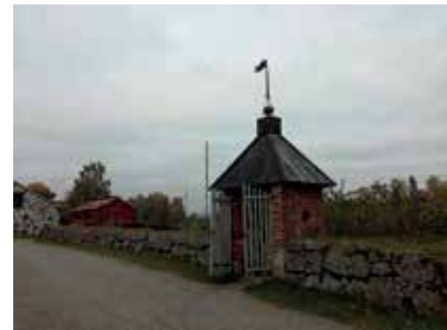
Puutarhaa suojaa muuri, joka erottaa sen selkeästi muusta pihapiiristä.

1700-luvun uutuus luonnonfilosofia elähdytti "Paluu luontoon" -teemallaan myös maisemapuutarhan syntyyn. Kiinalainen puutarhataide innoitti uutta maisematyyliä, joka liittyy rakennustaiteessa kustavilaiseen aikaan ja empireen. Ajan henki, joka ammensi innoitusta antiikista ja luonnonfilosofiasta, vaikutti tapaan tulkita ympäristöä. Kiinalaisten kirjojen, koriste-esineiden koristekuvien ja tussipiirrosten lumoavat kakkäräiset männyt, kalliot, vesipeilit, purot sekä niiden harmaa ja valkoinen tausta toivat mieleen pohjolan olot. Vaikka maise-