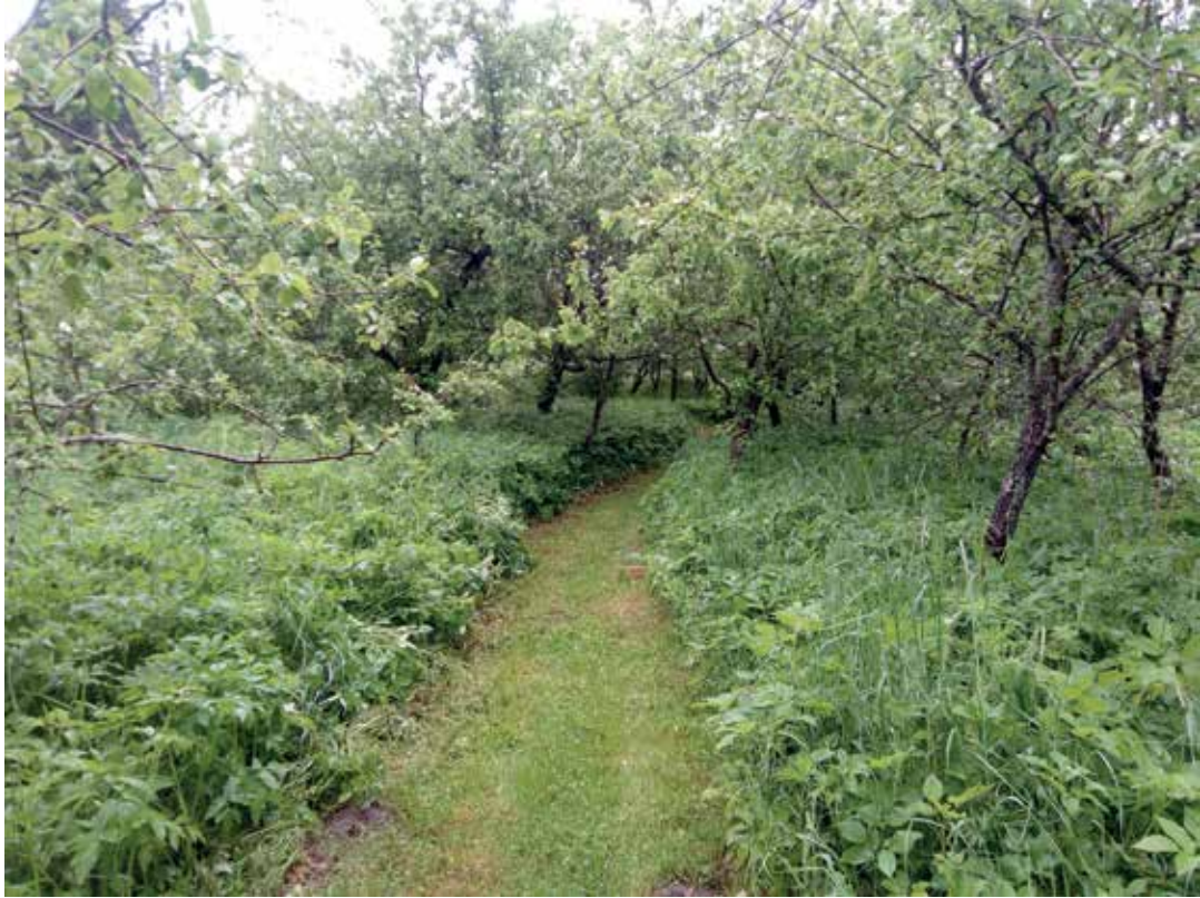
Omenapuita Rantakylän kartanossa. Tästä puutarhasta on lähtöisin viljelyssä olevia lajikkeita, kuten nimilajike "Grenman".

kartanon puutarhasta mainitaan kolme lajiketta: Kersti, Kenttämies ja Grenman, joista jälkimmäinen on kartanon entisen omistajan ja puutarhakoulun perustajan mukaan nimetty.