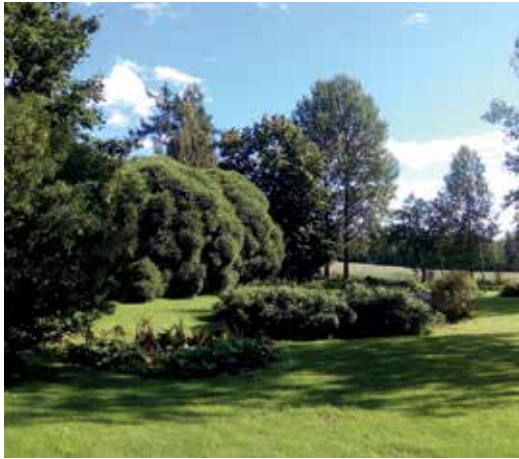
Löydön kartanon lampipuutarha 1900-luvun lopulta terijoensalavineen edustaa inventoitujen puutarhojen nuorimpia kerrostumia.