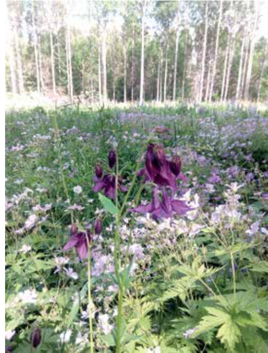
Kesällä 2017 akileijoja kasvoi jokaisessa puutarhassa. Akileijan taustalla kukoistaa Lakomäen metsäkartanon kukkaniitty.