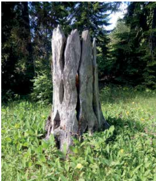
Vanha kanto on saanut uuden elämän taideteoksena.

Korkealle päälle ylle kaartuvat lehmuskujanteen oksaholvit tuovat mieleen keskiaikaiset goottilaiset katedraalit. Vai olisiko käynyt toisin päin: Katedraalit ovat syntyneet puukaarien alla?