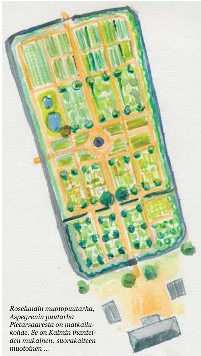
Roselundin muotopuutarha, Aspegrenin puutarha Pietarsaaresta on matkailukohde. Se on Kalmin ihanteiden mukainen: suorakaiteen muotoinen ...