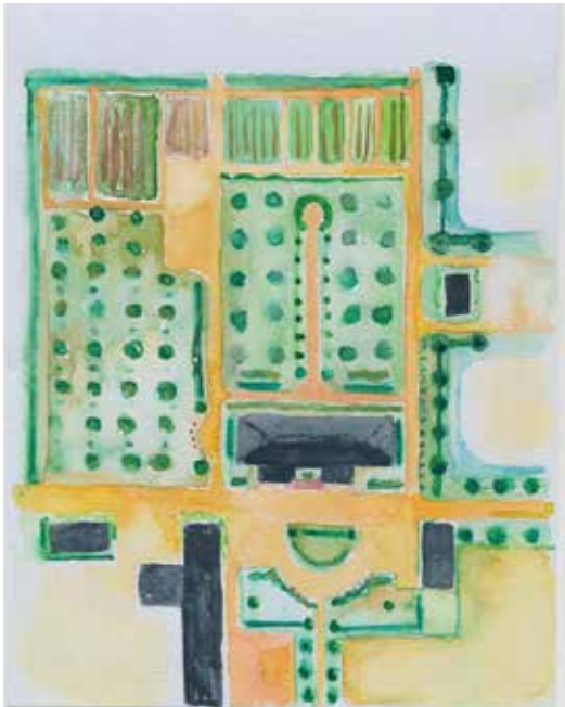
Mukaelma pihasuunnitelmasta vuodelta 1926, jota ei koskaan toteutettu luultavasti sen ylläpidon työläyden vuoksi. 1910-luvulla syntyi arkkitehtoninen tyyli, joka pyrki yhdistämään geometrisin muodoin rakennuksen ja puutarhan toisiinsa kokonaistaideteokseksi.