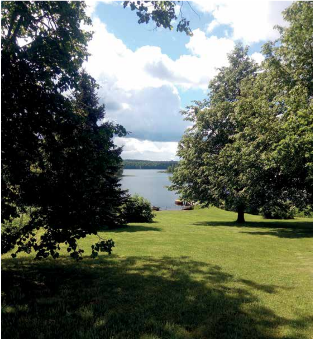
Loikansaaren puutarhasta avautuu näkymä järvelle. Kartanot ja virkatalot, kantatilat ja ratsutilat sijaitsevat tyypillisesti järvenrantakumpareilla.

mutta useimmissa kuvissa paistaa aurinko. Kaikki 17 puutarhaa olivat hoidettuja puutarhoja. Vain yhden puutarhan historiallisen osan tarkka sijainti löytyi vasta kansallisarkiston kätköstä. Inventoinnissa sovellettiin Ranja Hautamäen teosta Portti puutarhaan. Valtakunnalliseen puutarhainventointiin laaditussa ohjeessa puutarha kuvailaan sen osatekijöiden kautta, pääpiirteissään seuraavasti: puutarhan suhde ympäristöönsä, kasvillisuus, rakenteet, sommitelma, suunnittelija/perustaja, tila (häiriöt) ja historia.