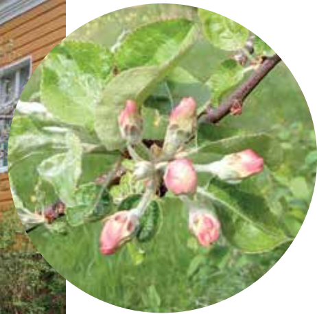
Tsaarin kilpi kohta kukassa.