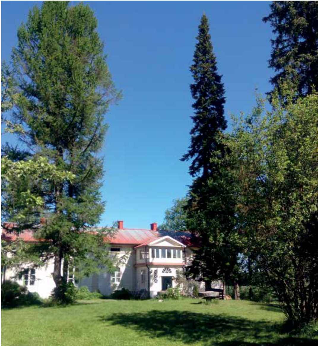
Iso-Koljonen, Jämsä. Päärakennus on empiretyyliä.

Tarkastelun mittakaava merkitsi sitä, että muutama mielenkiintoinen "kivi" jäi kääntämättä, kuten laajempi vertailu varhaisimpien ilmakuviensa 1930 ja -40-luvuilta. Näistä taustalähteistä on kerrottu enemmän seuraavassa luvussa. Inventointikesä 2017 ei ollut puutarhailmisen parasta aikaa, kevät tuli myöhässä, samoin kuin helteet, ensilumi kiirehti maahan jo lokakuun puolella,