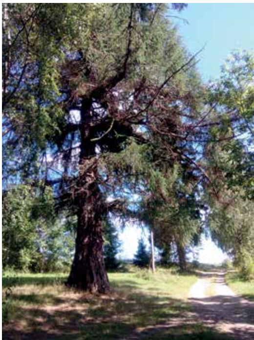
Löydön kartanon komea lehtikuusi.

Vanhojen puiden säilyminen puutarhassa on vaalimisen arvoista. Kaadettu puu on aina menetyksen sommitelmalle. Jalot lehtipuut voivat kestää lahoa hyvinkin pitkään, joten silmämääräinen arviointi on vaikeaa. Usein myös arboristin asiantuntemus paikan päällä on tarpeen, kun arvioidaan vaikka vanhojen lehmusten kuntoa ja