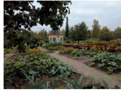
... keskellä komeileva huvimaja.