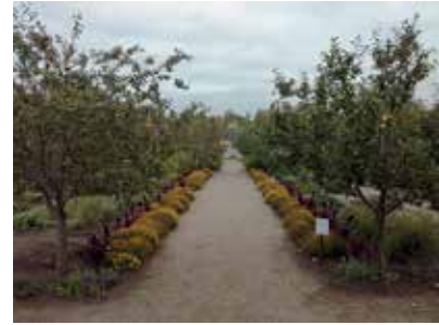
Leveiden hiekkakäytävien jakamat nelijakoiset erilliset korttelit hedelmäpuineen...