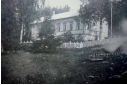
Vanha valokuva Kuhmoisista kuvaa, kuinka puutarhat olivat ennen aidattuja: säätyläispuutarha oli erillään muusta pihasta. Monet vanhat rakenteet, kuten puuaidat ovat kadonneet puutarhoista.

lopun "saksalaisen tyylin" puutarhasommitelmia saattoi havaita muutamissa kohteissa, kun vanhojen valokuvien ja etenkin ilmakuvienv pohjalta tiesi etsiä. Näitä merkkejä olivat mm. nurmipinnan kuperuus, kivirakenteet, käytävien kohdalla niukakasvuisempi nurmi tai puurivistöjen kaarevat linjaukset, jotka sitten löytyivät maastosta.