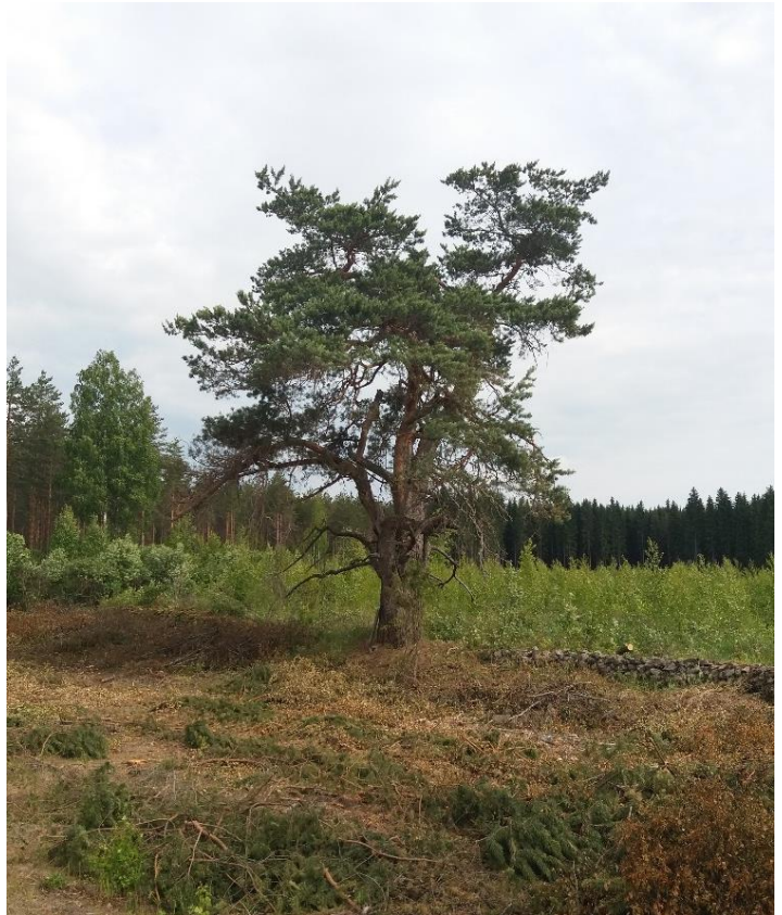
Kuva 13 Raivauksella petäjä saatiin esiin maisemasta.

Jani Haajanen vaihtoi luonnonmuistomerkkikylttiin uuden jalan ja asensi sen paikalleen. Männyn kuolleet ja keloutuneet oksat annetaan olla paikoillaan. Ainoastaan kokonaan irronneet ja toisiin oksiin roikkumaan jääneet oksat voidaan poistaa, jos ne häiritsevät. Muuten mänty saa jatkaa omaa elämäänsä. Männyn viereen tehdään opaskyltti, johon tulee tietoa sekä männystä että kiviaidasta.