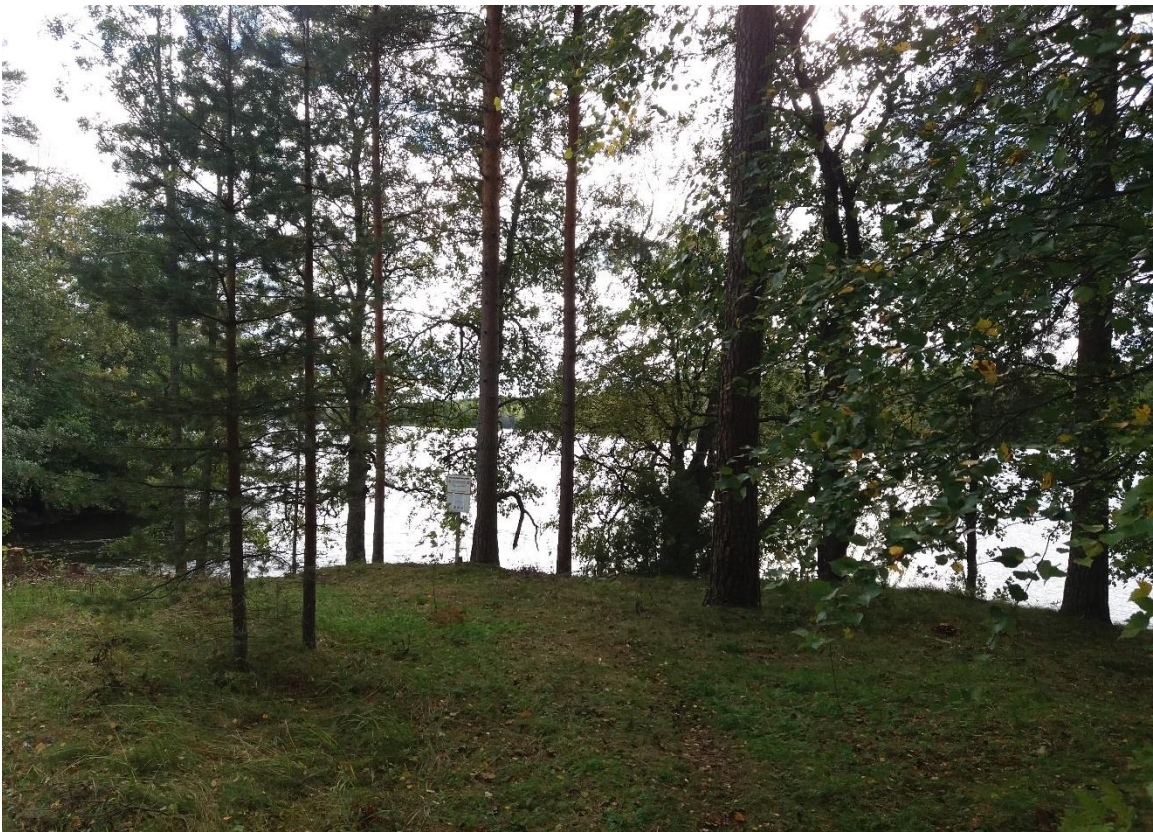
Kuva 8 Piknikpaikka raivauksen jälkeen.