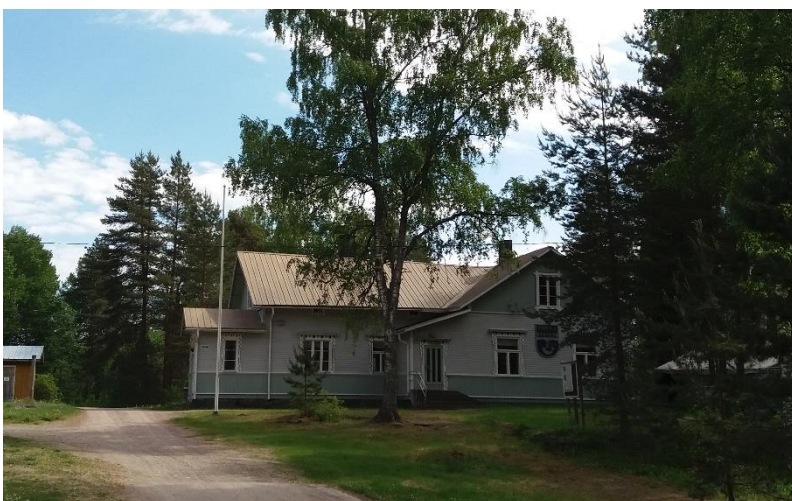
Kuva 2 Toivolan maamiesseurantalo