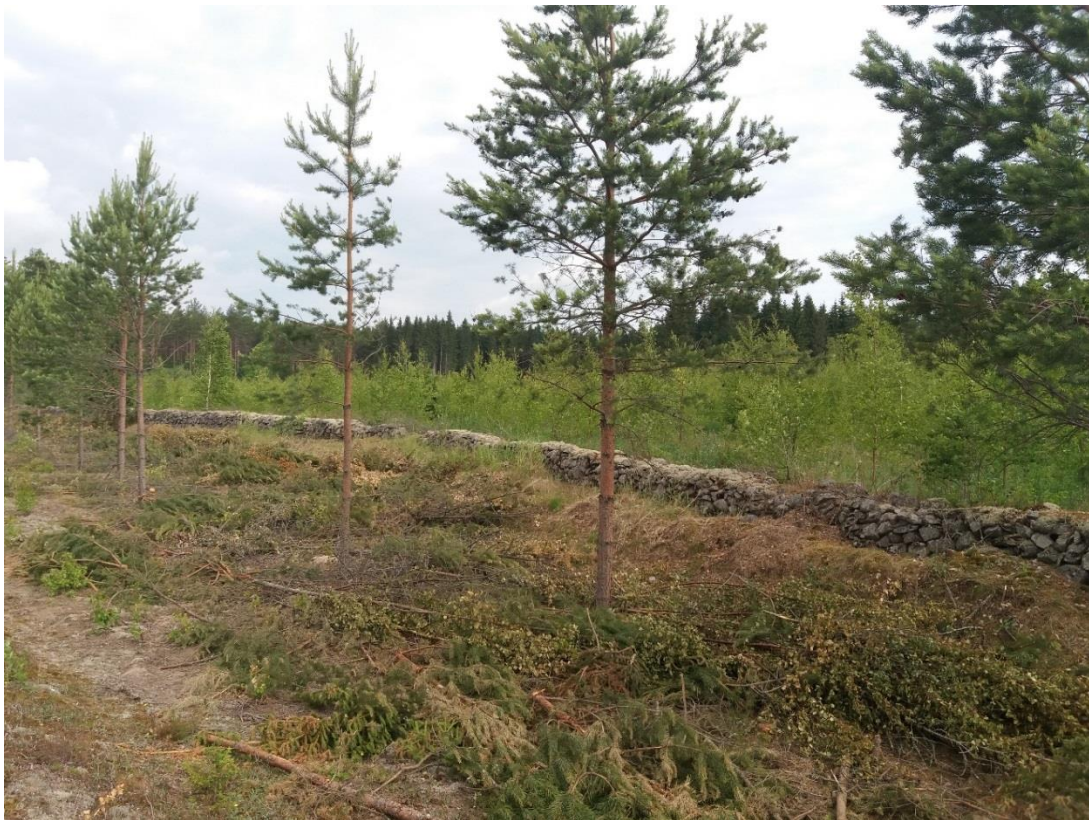
Kuva 12 Kiviaita männikön harvennuksen jälkeen.