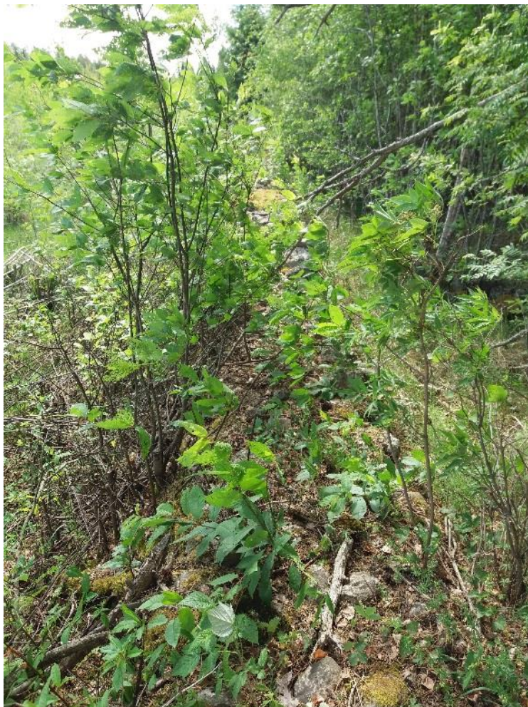
Kuva 10 Hoitamattomana vesakko peittää kiviaidan nopeasti alleen.

Kiviaidan sortumat voidaan korjata latomalla sortuneet kivet takaisin paikoilleen. Jos ladontatavasta ei ole varmuutta, voi olla parempi jättää sortumat paikoilleen. Aidan päällys on hyvä pitää puhtaana roskista ja liiasta karikkeesta sekä pudonneista oksista.