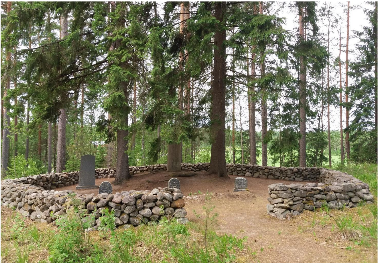
Kuva 16 Vanha hautausmaa on hyvin hoidettu.

Hautausmaa kuuluu edelleen Lahdenhovin maihin ja Lahdenhovin nykyiset omistajat huolehtivat hautausmaan hoidosta mm. haravoimalla ja kitkemällä alueen säännöllisesti. Hautausmaalle johtaa Pertumaantieltä vanhan petäjän kohdilta haarautuva pieni tie. Tiellä ei ole mitään hautausmaasta kertovaa tienviittoa.