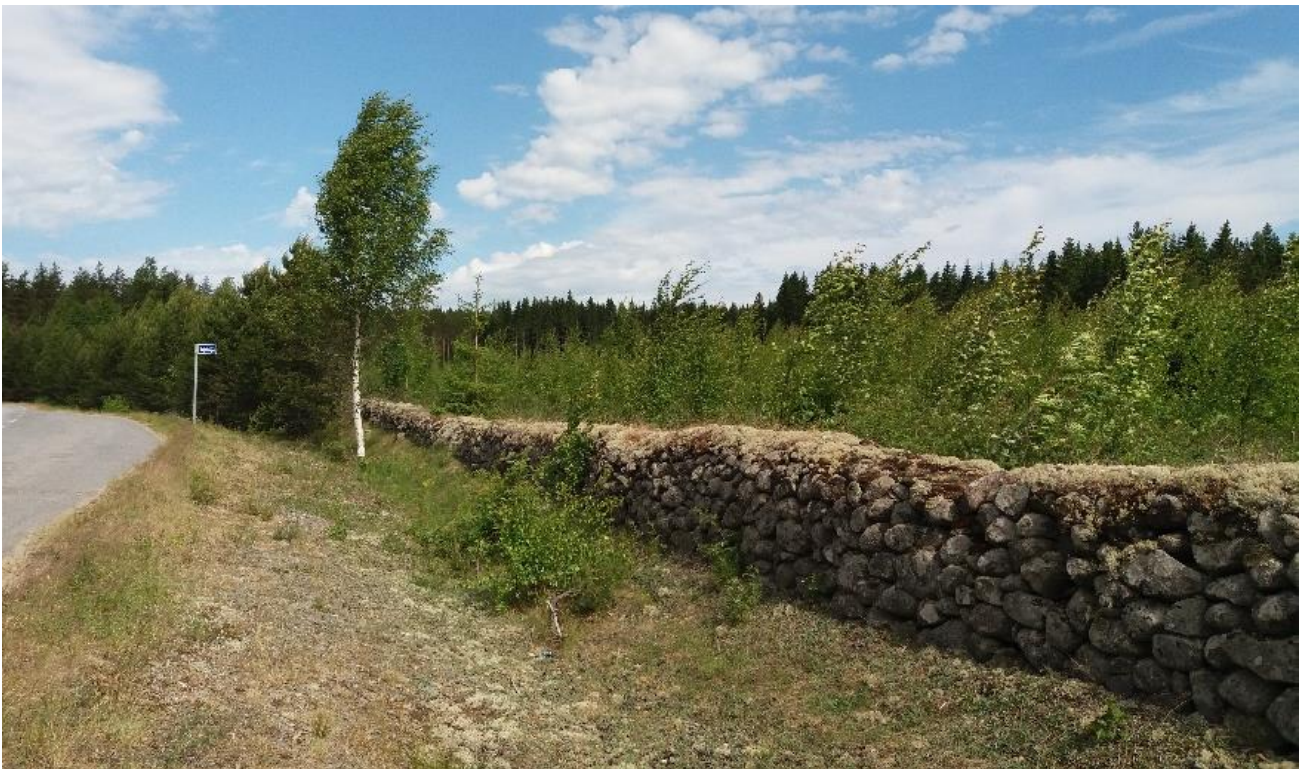
Kuva 9 Kiviaidan eteläpää näkyy hyvin tielle.

Kiviaidassa on pieniä sortumia, mutta pääosin aita vaikuttaa hyväkuntoiselta. Suurin uhka aidan rakenteelle on ympäröivä puusto, jonka juuret tunkevat aitakivien väliin ja voivat vääntää kiviä paikoiltaan. Lisäksi varjostava puusto muuttaa kiviaidan paahde-elinympäristöä, jolla viihtyvät tietyt harvinaistuneen kuivilla ja lämpimillä kivipinnoilla viihtyvät lajit.