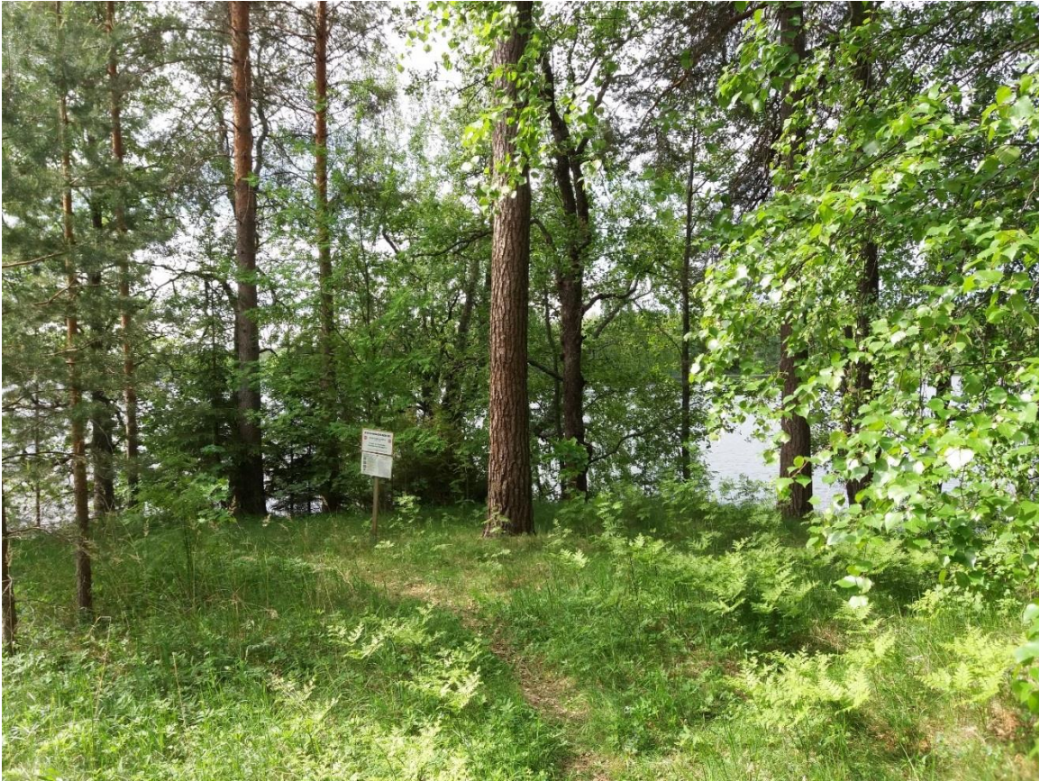
Kuva 7 Piknikpaikka ennen raivausta.