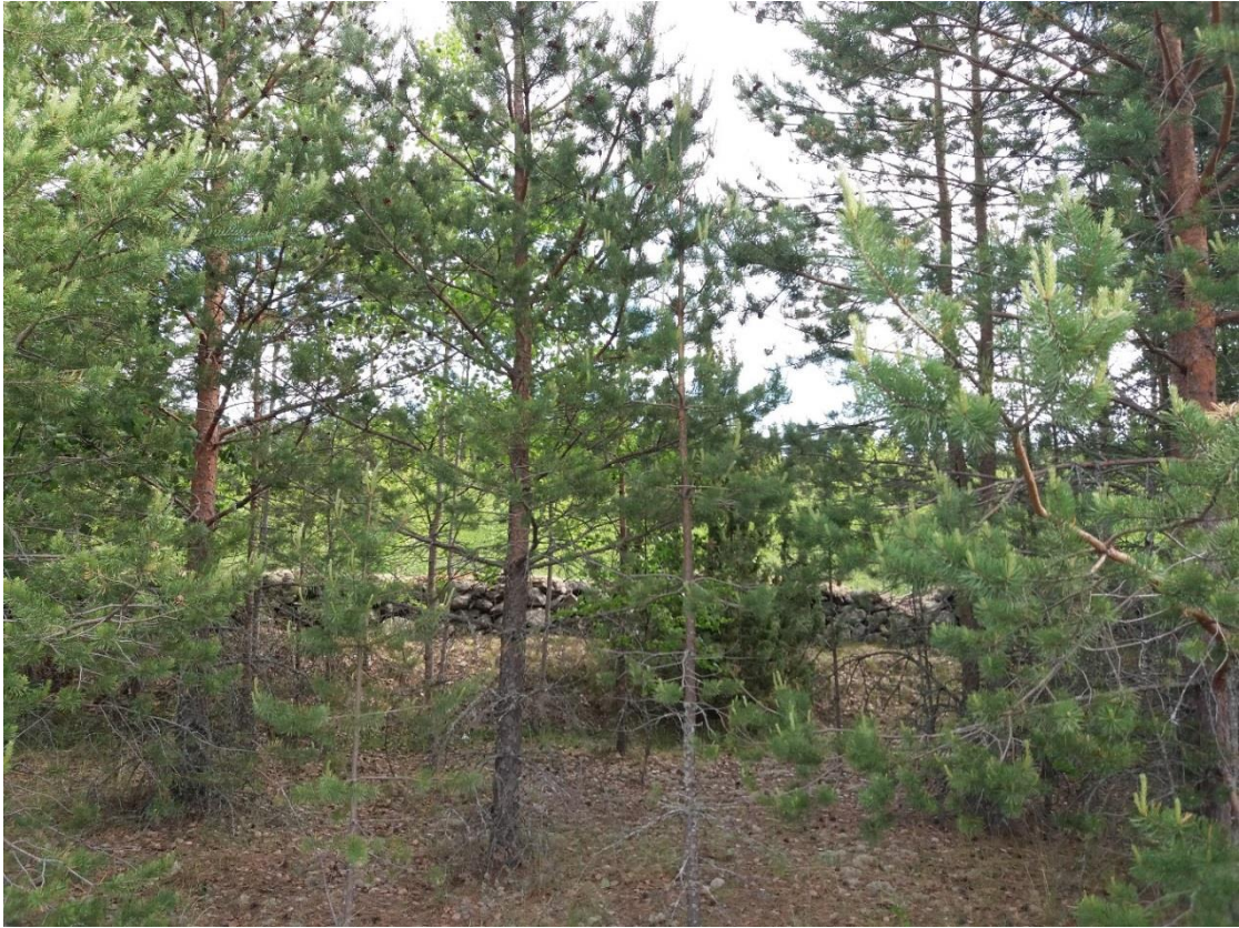
Kuva 11 Kiviaita ennen männikön harvennusta.