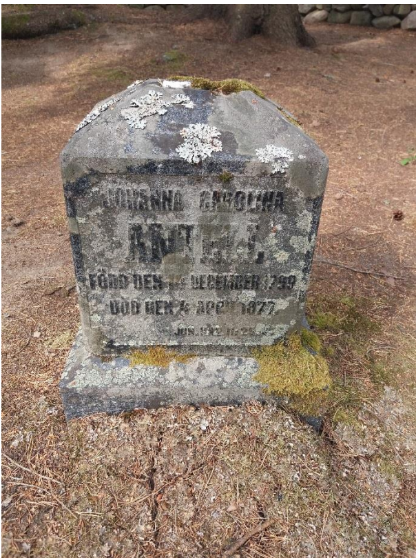
Kuva 18 Sammal ja jäkälä on alkanut peittää hautakiviä.

Kirjainten kultausta on tehty monella eri tavalla ja materiaalilla. Aito kultaus on perinteisesti tehtynä hienostunein menetelmä. Kultausten teko vaatii kokemusta ja erinomaista tarkkuutta, siksi kirjainten kultaustyö jätetään useimmiten hautakivitoimittajien tehtäväksi. Kirjaimet on voitu myös maalata kullan tai hopean värisiksi. Maalaukseen tulee käyttää ulkoilmaan sopivia tuotteita. Vanhimmissa hautakivissä tekstikaiverukset on kultausten sijasta korostettu mustalla värillä. Niiden uusiminen voidaan tehdä ulkoöljymaalilla.