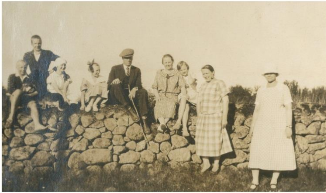
Lahdenhovin väkeä ja vieraita kiviaidalla 1920-luvulla.