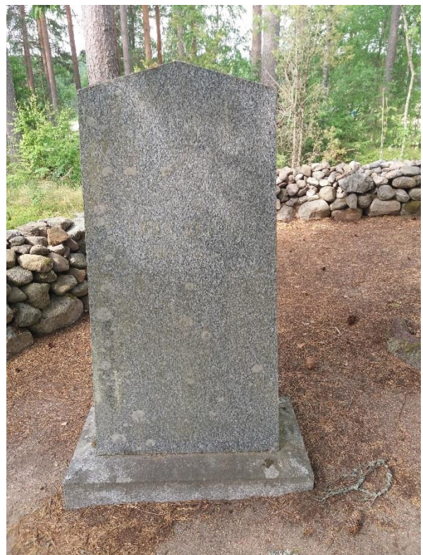
Kuva 19 Joistakin hautakivistä teksti on kulunut lähes näkymättömiin.