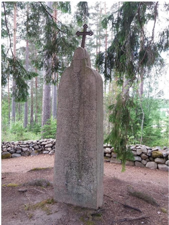
Kuva 17 Kärjestään murtunut hautakivi ja irronnut rautaristi vaativat ammattilaisen kunnostusta.

Vuolukivestä valmistettujen hautakivien pesemisessä ei saa käyttää liian kovia harjoja, sillä vuolukivi on nimensä mukaisesti pehmeää ja voi helposti vahingoittua pinnastaan. Hautakiven pesemisessä ei saa käyttää kuumaa vettä, sillä sen aiheuttama äkillinen lämmönlaajentuminen saattaa rikkoa kiven kulmia ja kivessä mahdollisesti olevia ohuempia osia. Kalkkikiven