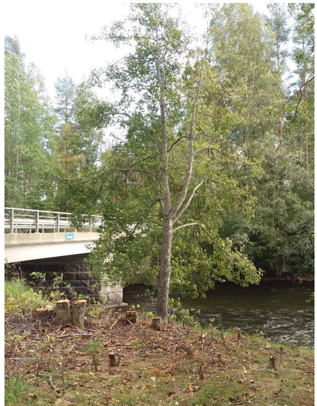
Kuva 4 Voimakas raivaus avasi näkymän.