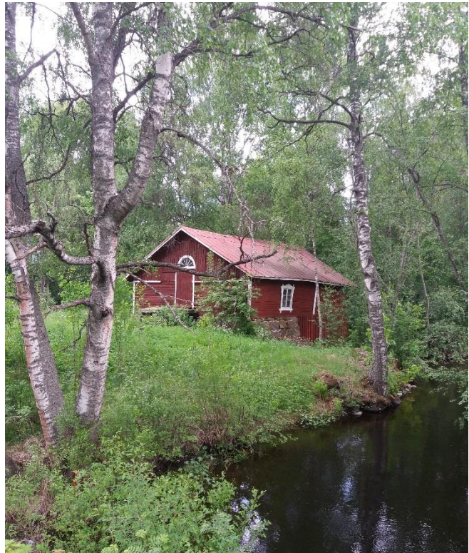
Kuva 1 Tuustaipaleen mylly

Toivolaa halkoo Tuustaipaleen kanava, joka on varhaisimpia Suomen sisävesille tehtyjä kanavia. Lähiseudun talonpojat perkasivat kanavan 1770-luvulla. 1830-luvulla keisarillisen koskenperkaustoimikunnan johdolla kanavaa perattiin uudelleen, jotta Puulan vedenpinnan tasoa saatiin laskettua ja ranta-alueita paremmin viljelyskäyttöön. Tämän myötä Tuustaipaleen vesimylly hieman etelämpänä jäi kuiville. Koskenperkaustoimikunta rakensi kuitenkin uuden uoman myllylle ja mylly sai jäädä lähes entiselle paikalleen.