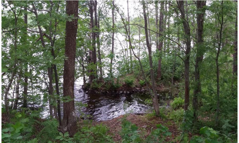
Kuva 5 Kunnostettava uimapaikka kesällä.

Hoitotoimenpiteet saatiin tehtyä pääosin kesän 2018 aikana, mutta muutama rannassa kasvava suurempi puu jätettiin poistettavaksi vasta talvella. Jatkossa aluetta hoidetaan kerran kesässä tehtävällä raivauksella, jonka tavoitteena on pitää maisema avoimena, siistinä ja houkuttelevana. Kyläyhdistys ottaa paikan hoidettavakseen. Paikalla ei ole jätehuoltoa, joten on seurattava alkaako alue roskaantua.