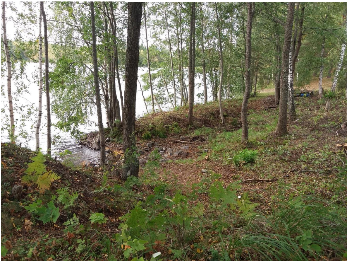
Kuva 6 Uimapaikan raivauksen jälkeen syksyllä, kun vesi oli alempana.