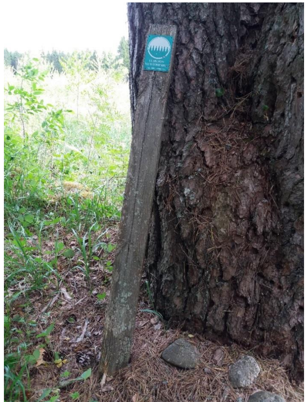
Kuva 15 Luonnonmuistomerkki-kyltti ennen kunnostusta.