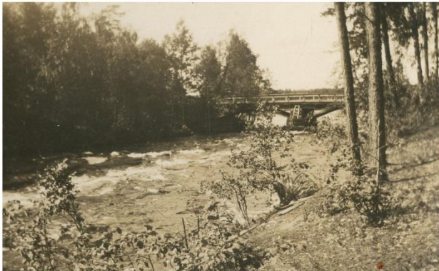
Kaivannonkoski ja vanha puusilta 1920- ja 1930-luvun vaihteessa.