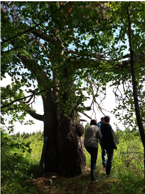
Kuva 14 Ennen raivausta petäjä ei näkynyt tielle.