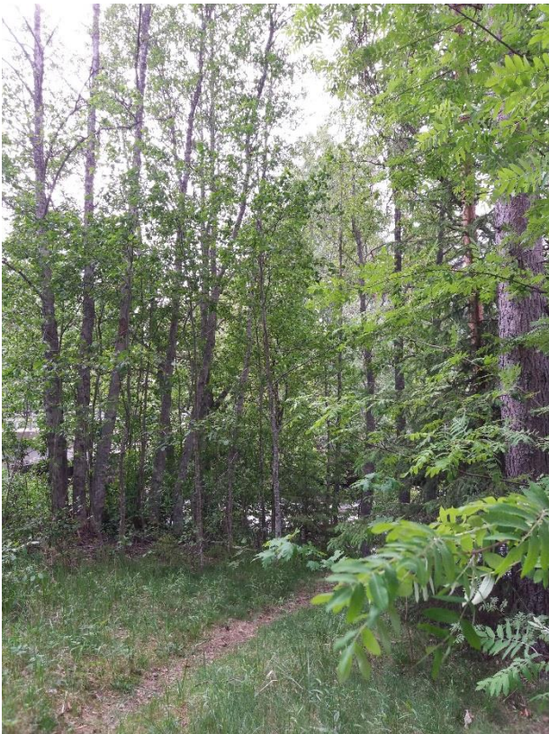
Kuva 3 Ennen raivausta näkymä koskelle oli ummessa.

Parkkipaikalle ohjaa tällä hetkellä kaksi parkkipaikan palveluopastetta. Hankkeessa ehdotettiin selkeämpien levähdyspaikan tieopasteiden hankkimista, mutta lupaprosesseineen se todettiin liian kalliiksi. Sen sijaan paikalle teetettiin kyltti, jossa kerrotaan paikan historiasta. Kylttiä kuvittaa Lahdenhovin arkistoista löytynyt kuva koskesta ja sen ylittäneestä vanhasta puusillasta 1920- ja 1930-luvun vaihteessa.