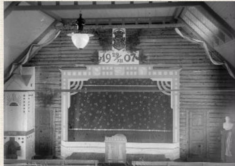
Seuraintalo, kuva Toivo Paatola 1907, Vapriikki. Finna.