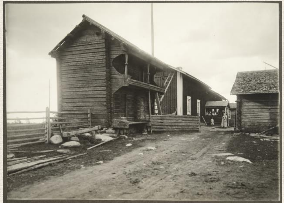
Luhti Pieksämäeltä. Kuva U. T. Sirelius 1915, Museovirasto. Finna.