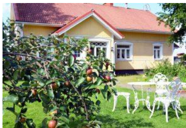
Suoramyynti ja kesäkahvila