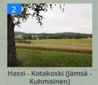
Hassi - Kotakoski (Jämsä - Kuhmoinen)