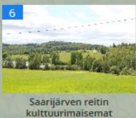
Saarijärven reitin kulttuurimaisemat